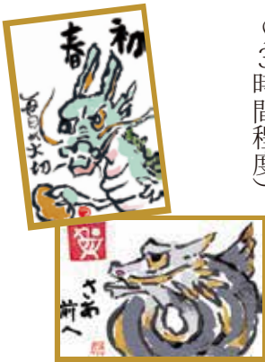
▲ 個性豊かな筆遣いの作品