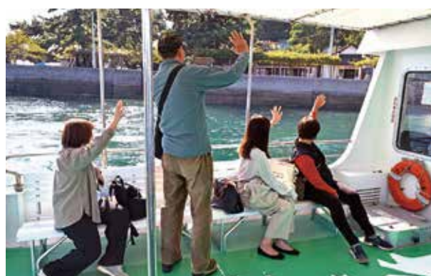
▲ 見送りに来た郷土料理研究会のメンバーに手を振るツアーの参加者