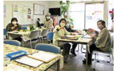
▲ 絵手紙がつなぐ人の輪も魅力

何より絵手紙の楽しさは、学びを分かち合える相手、絵友の存在で、全国に作る事ができます。だからやめられません。