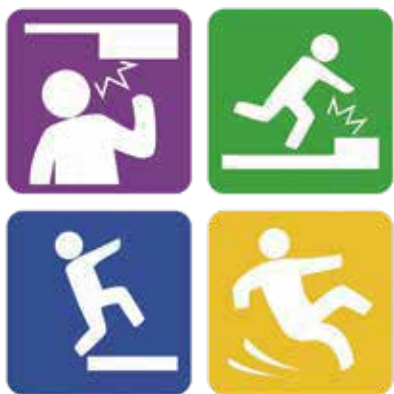
▶ 自宅や仕事場での転倒などによるケガが増えている

たことが原因となっています。せっかく仕事をしてもらっても事故(人身も物損も)になってしまったりは元も子ありません。再度「心にゆとりを持って」安全就業を心がけましょう。