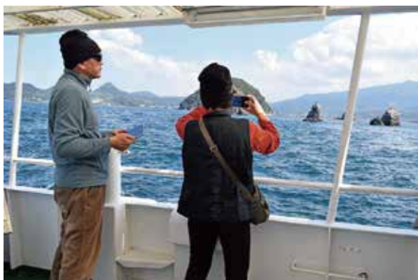
▲ 美しい風景をカメラで撮影

伊予の地で一大勢力を誇った豪 族・河野氏ゆかりの地は、今も松 山市内に数多く点在している。本 拠地があった北条地区はもちろ ん、道後公園内にある湯築城跡な ど、注目度があり高くなかった 名所・旧跡を新たな観光資源とし て活用した旅行企画がこのモニ ターツアー。今回のツアーでは、 台湾から来松した4名のお客さん と関係者が河野氏ゆかりの地を ゆつくりと訪ねた。