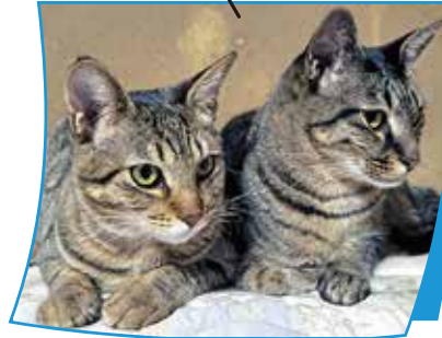
▶正岡さん家のはる君(2歳)とあき君(1歳) (左) (右)