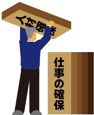
▲新たな取り組みが始まる

令和5年11月30日開催の第2回「営業推進実行委員会」では、事務局が今年度派遣事業実績の報告を行い、金額ベースで前年度比108.6%、就業延日数ベースで107.2%伸長した旨の説明がありました。