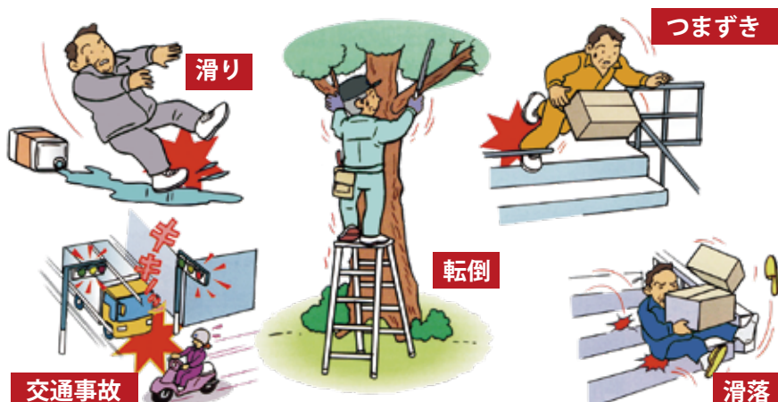
▶ 就業中の事故やケガの原因は、気のゆるみや注意不足が多い

たことが原因となっています。せっかく仕事をしてもらっても事故(人身も物損も)になってしまったりは元も子ありません。再度「心にゆとりを持って」安全就業を心がけましょう。