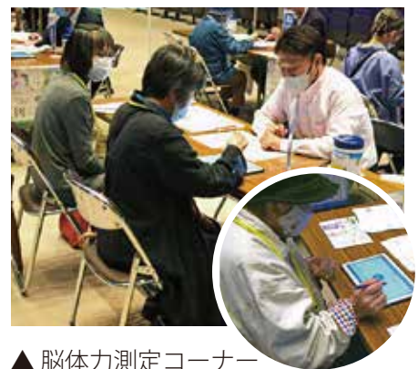
▲ 脳体力測定コーナーには現役世代の姿ちらほら

会場のカメラリアホールには、デジタルを活用し「誰もがつながることができる社会を目指し、シニア層を中心にさまざまな世代が楽しめるコンテンツエリアを設置。センターの会員や一般の家族連れなど、468人の方々が来場し、eスポーツのほか、各エリアで多彩なデジタルコンテンツを楽しんでいました。