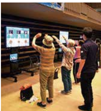
▲ モーショントレーニングシステムTANOを楽しく体験

会場のカメラリアホールには、デジタルを活用し「誰もがつながることができる社会を目指し、シニア層を中心にさまざまな世代が楽しめるコンテンツエリアを設置。センターの会員や一般の家族連れなど、468人の方々が来場し、eスポーツのほか、各エリアで多彩なデジタルコンテンツを楽しんでいました。