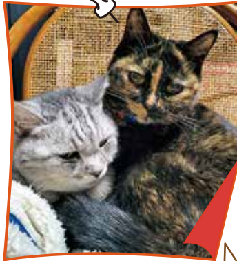
▶正岡さん家のピーちゃん(16歳)とリコちゃん(19歳) (左) (右)