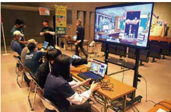
▲ 松山学園eスポーツクラブの生徒の補助でシニアもeスポーツを存分に楽しむ

eスポーツ体験エリアでは、FALLGUYS、どうぶつタワーバトル、ぷよぷよといった3種類のeスポーツをシニアから小さな子どもまで幅広い層がチャレンジして