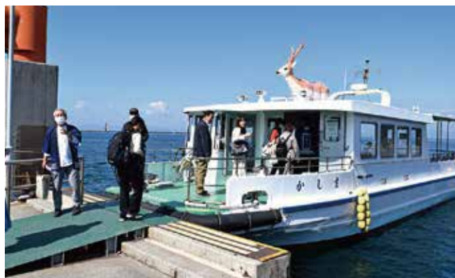
▲ 屋根にちょこんと鹿が乗った渡船で鹿島へ

生涯現役松山地域連携事業と きらりシルバー応援事業で始 まった2つの事業が、古の豪族・ 河野氏ゆかりの地を巡るモニ ターツアーでコラボレーション。