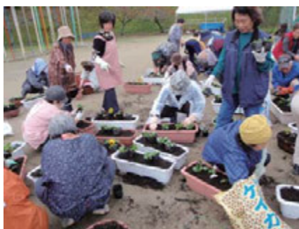
仮設住宅の高齢者とヘルパーで花植え共同作業

も介護員養成研修を行ったが、震災で職を失いハローワークの紹介で受講した60歳前後の方達は、失業手当を受け取りながら受講する間に、会員の確保には繋がりにくい。