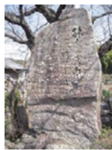
子規の俳句と漢詩碑

の二三（一八八九）年の二回、友人らと久万地方へ旅した。「三坂即事」と題する漢詩と「旅人のうた登り行く若葉かな」の句を遺し、双方を一つの石に彫った碑が、三坂峠への上り口・窪野町丹波の公民館前石垣上にある。