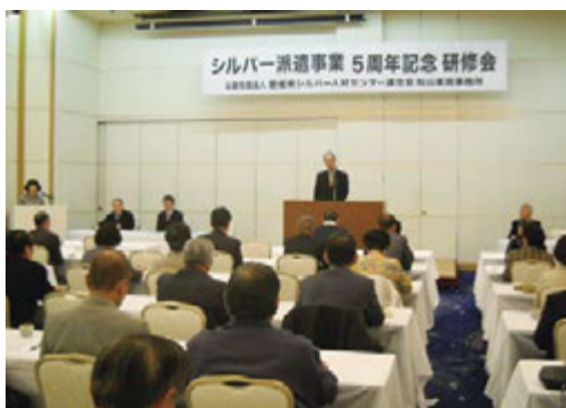
派遣事業5周年記念研修会

平成24年3月20日(火) 東京第 一ホテル松山に於いて「シルバ ー派遣事業5周年記念研修会」が 開催されました。