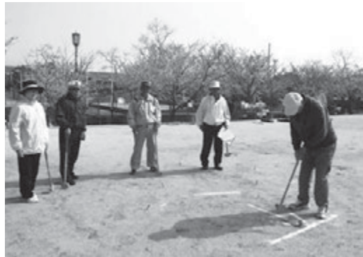
北条グランドゴルフ大会

昨年度は新たな試みとして地域の清掃ボランティア、ミニコンサート等のイベント的なものに取り組みました。より地域に根ざした形で連携が図れて有意義な試みとなったのではないかと思えます。