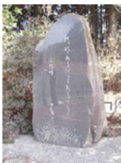
峠の展望台にある山頭火碑

放浪の自由律俳人・種田山頭火も、松山を終の住処と決めた昭和一四年に三坂峠を下っている。一月二日朝、四四番札所・大宝寺に参詣「朝まるりはわたくし一人の銀杏ちりしく」と詠み、町内を托鉢した後、三坂峠を下った。その時の数句のうち「秋風あるいてもあるいても」の句碑が、松山方面を展望できる場所にひっそり建っている。