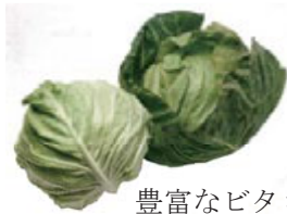
豊富なビタミンCが風邪の予防や肌荒れ疲労回復に効果的

化学名はキャベジンと呼ばれ、市販の胃腸薬の成分として活用されている。胃腸に効く。