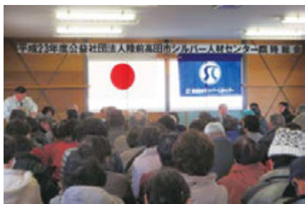
臨時総会：頑張って昨年の12月1日に公益法人に移行しました

市が掲げる地域の復興、産業の再生と発展の為、当センターは方向性を同じくして各事業を進めて