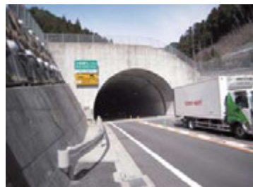
「三坂道路」の東明神側トンネル出口

重ねたものの、急峻な山を海拔七二〇メートルまで一気に登るだけに、カーブの多さは如何ともし難く、ついに久谷町大平から久万の東明神まで、トンネルを抜く案が浮上。 平成十一年度に着工、今年三月に自動車専用道「国道33号三坂道路」として開通した。新道路は、三一〇メートルのトンネルや、橋脚の高い橋などを多用し、急カーブや急勾配を減らした快適道路になった。最高地点も33号三坂峠より一一〇メートルも低い。