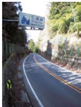
国道33号三坂峠頂上付近の標識

高速道の松山道―高知道などを、車で難なく実現できる。しかし、明治時代半ばまでは、松山の札ノ辻から荏原、坂本を経て、宿場町・久万（現・久万高原町）に出、仁淀川沿いに高知へ向かう土佐街道が主要道路で、難所が多かったという。 この街道中で「最大の難所」