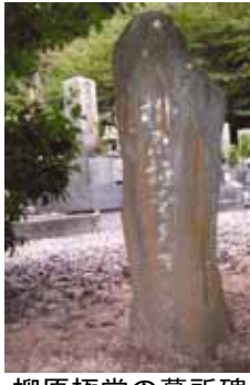
柳原極堂の墓所碑 た俳人・柳原極堂の墓所がある寺だ。

この道の途中、信号手前右の山田町の山陰に、鷲栄山妙清寺がある。正岡子規の朋友で、俳誌「ほととぎす」を創刊し、子規、漱石と親しみ、子規亡き後も子規顕彰に尽くし