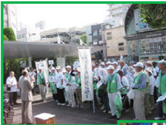
市駅前坊っちゃん広場

そのあと、市内中の川よりロープウェー街・JR松山駅・道後温泉街付近を参加者77名で各11か所に分散。市民にも美化意識を高めてもらうために、松山市環境事業推進課より配布されたPRティッシュを配りながら11時30分まで清掃を行った。