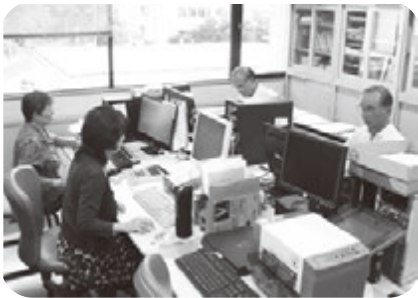
印刷夢工房の作業風景