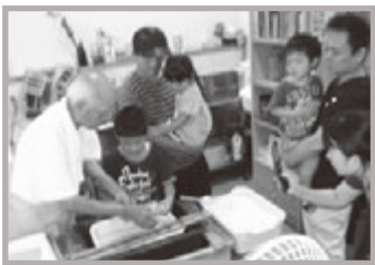
手漉き和紙体験コーナー