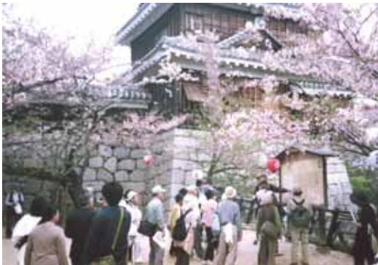
満開の桜の下 松山城探訪

私達は、この郷土のすばらしさを次世代に語り継ぎ、保持して参りたいと願うものです。