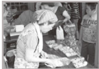
赤飯・さざえ販売