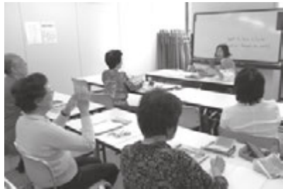
愛媛新聞カルチャー英会話

に一人暮らしのお年寄りに声をかける「愛のひと声運動」を実施しています。新聞受けに新聞がたまっていたり焦げ臭いにおいがしたりなど、普段と違う様子はないか目配りしながら日々の配達を行ってまいります。