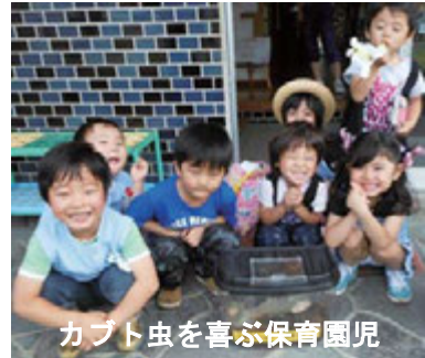
カブト虫を遊ぶ保育園児

し、市内幼稚園保育園等に贈る活動を行ったところ、子供たちの笑顔を見ることができました。