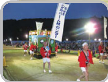
城山公園でもシルバー人材センターの山車PR