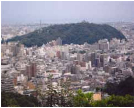
瀬戸風峠から望む松山市（城東）