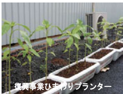
復興事業ひまわりプランター

い地の貴センター様の応援に依るよう、会員役職員一丸となって事業推進に努めて参りたいと思