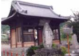
極堂の句碑 丘へ涼しき樹下の径「振り返りみる故里の山粧う」など、土地に関係する俳人の句碑もある俳人の句碑も見える。

薄墨桜は、和名イヨウズミザクラと呼ばび、ヤマザクラ系の一品種と考えられている。本堂前にあり、白色に微紅を帯びる上品な花。昔、一山挙げて某皇后の病氣平癒を祈願して健康が回復したことに、勅使が薄墨の繪旨に桜を添えて下されたので、薄墨桜と称したという。