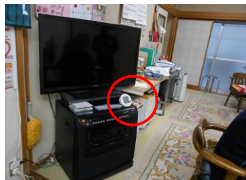
(二酸化炭素センサー 8台)

本部、支部(事務所)、福祉事務所(事務所、デイサービス、会議室)に設置。密になりやすい場所に設置し数値の可視化とアラームで適宜換気を促す。